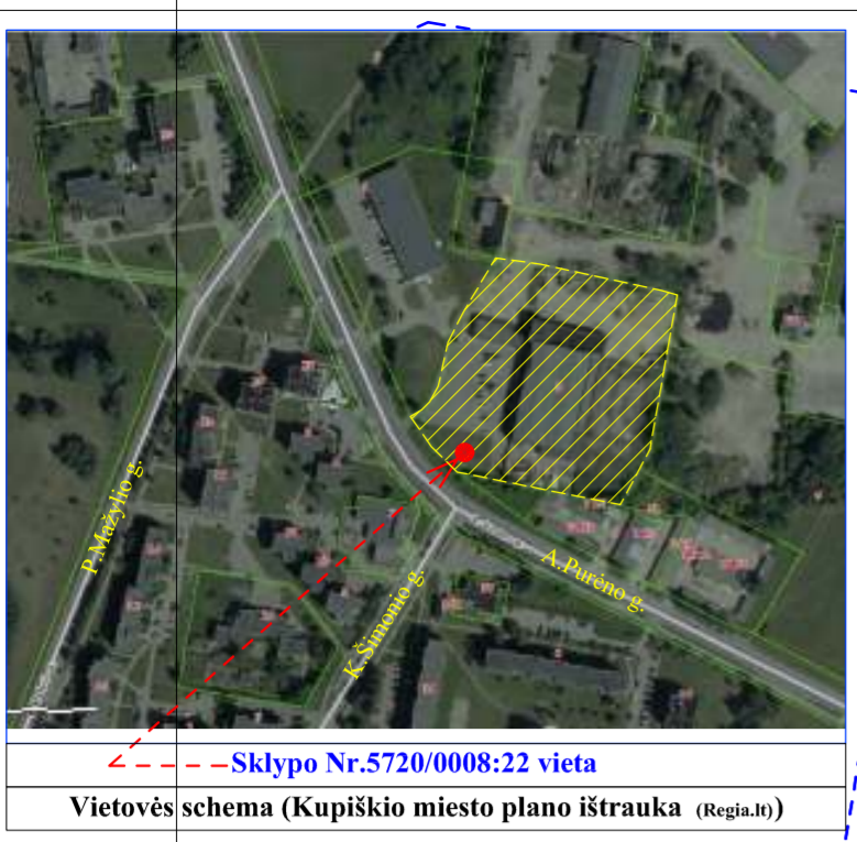
Vietovės schema (Kupiškio miesto plano ištrauka (Regia.lt))

Sklypas: 0,9385 ha, kad. Nr.5720/0008:19, adresu A.Purėno g. 1. Komercinės paskirties objektų teritorijos. Priklausomybė - UAB "BSP Retail Properties I"